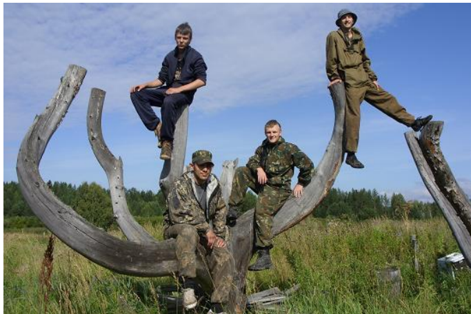
Скульптурная композиция в ур. Большие Ключи.

Урочище Большие Ключи в разное время использовалось под фермерское хозяйство и как место гостевой таёжной заимки