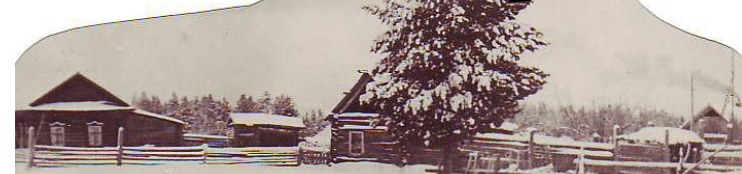
Любимая кедрка у старого дома Созиновых