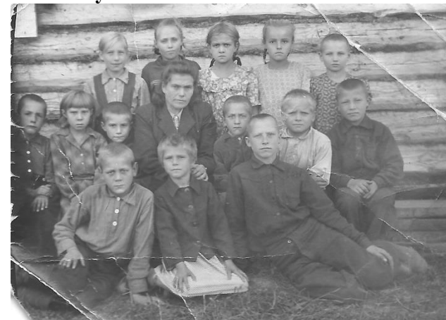
На фото д. Большие Ключи: жители на улице Больших Ключей 1962 год