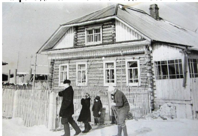
На фото д. Большие Ключи: школа 1955 год