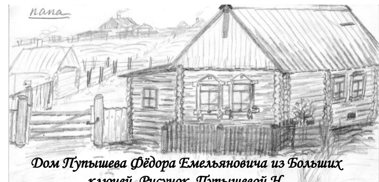
Дом Путьшева Фёдора Емельяновича из Больших Ключей. Рисунок Путьшевой Н.